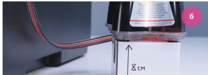
Установка СНПЧ. Рис. 6

11 Емкости-доноры должны находиться на высоте 8см от нижнего края МФУ (рис. 6).