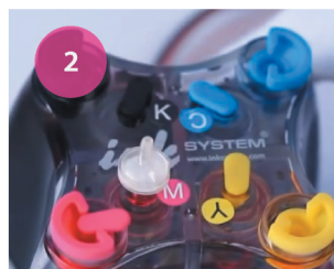
Установка СНПЧ. Рис. 2

2 Извлеките маленькие заглушки и аккуратно на их место установите воздушные фильтры (рис. 2). Обязательно сохраните заглушки для дальнейшей транспортировки принтера с установленной СНПЧ.