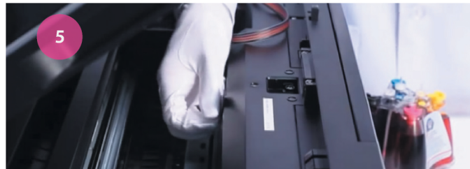
Установка СНПЧ. Рис. 5

10 При появлении на мониторе МФУ сообщение о необходимости заменить чернильный картридж, выполните процедуру, описанную в разделе «Обновление уровня чернил».