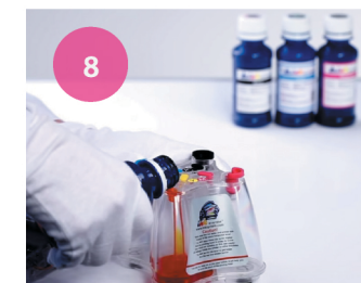
Заправка СНПЧ. Рис. 8

3 По окончании заправки, закройте заправочные отверстия (рис.9) и откройте воздушные. На место заглушек необходимо установить воздушные фильтры (рис.2). Заглушки воздушных отверстий установите в специальные отверстия на заправочных для дальнейшей эксплуатации СНПЧ (транспортировка, заправка).