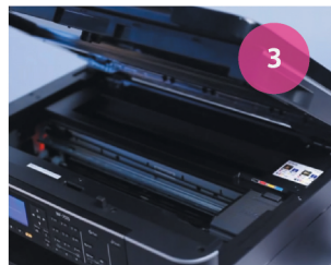
Установка СНПЧ. Рис. 3

3 Подключите сетевой шнур к МФУ и включите устройство. На экране появится сообщение об отсутствии картриджей.