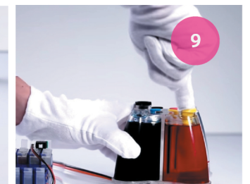
Заправка СНПЧ. Рис. 9