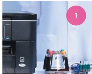
Установка СНПЧ. Рис. 1

1 Поставьте СНПЧ с правой стороны принтера (рис. 1) и расправьте шлейф.