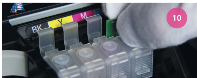
Обновление уровня чернил. Рис. 10

УБЕДИТЕСЬ, ЧТО ЧЕРНИЛ В ДОНОРАХ ДОСТАТОЧНО. В ПРОТИВНОМ СЛУЧАЕ ДОЗАПРАВЬТЕ ИХ. НЕ ДОПУСКАЙТЕ ТОГО, ЧТОБЫ ЧЕРНИЛА ОПУСКАЛИСЬ НИЖЕ КРАСНОЙ ОТМЕТКИ