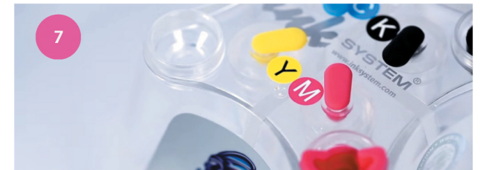
Заправка СНПЧ. Рис. 7

1 Для заправки СНПЧ закройте воздушные отверстия и откройте заправочные (рис. 7).