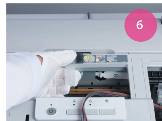
Установка СНПЧ. Рис. 6

7 Переместите каретку в крайнее левое положение, затем в крайнее правое положение. Проверьте, не перекручивается ли шлейф и не мешает ли он ходу каретки. Шлейф не должен провисать.