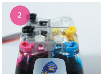
Установка СНПЧ. Рис. 2

2 Извлеките маленькие заглушки и аккуратно на их место установите воздушные фильтры (рис. 2). Обязательно сохраните заглушки для дальнейшей транспортировки принтера с установленной СНПЧ.