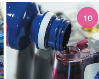
Заправка СНПЧ. Рис. 10

2 Через заправочное отверстие заправьте каждый донор СНПЧ чернилами соответствующего цвета (рис. 10).