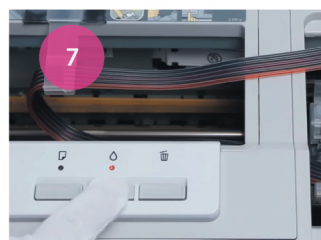
Установка СНПЧ. Рис. 7

Зажмите кнопку обнуления над картриджами на 5-7 секунд (рис. 8). Нажмите кнопку капля. Закройте крышку. Через несколько минут принтер будет готов к работе.