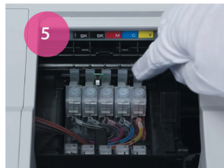
Установка СНПЧ. Рис. 5

6 Установите держатель посередине принтера и закрепите в нем чернильный шлейф (рис. 6). Для корректной работы принтера шлейф не должен быть перекручен или мешать ходу каретки.