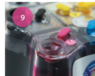
Заправка СНПЧ. Рис. 9

1 Для заправки СНПЧ откройте заправочное отверстие, извлекая силиконовые пробки (рис. 9).