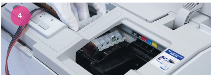
Установка СНПЧ. Рис. 4

4 После этого переместите каретку в крайнее правое положение, блок картриджей проденьте под планкой корпуса (рис. 4). Передвиньте каретку немного левее.