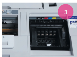
Установка СНПЧ. Рис. 3

4 После этого переместите каретку в крайнее правое положение, блок картриджей проденьте под планкой корпуса (рис. 4). Передвиньте каретку немного левее.