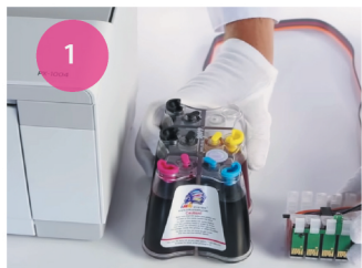
Установка СНПЧ. Рис. 1

1 Поставьте СНПЧ с левой стороны принтера (рис. 1) и расправьте шлейф.